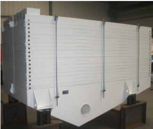
Produktions-MHR 20/28/XVII (2 IIX) Breite 2000 mm, Länge 2800 mm, mit 17 Decks und zwei Siebeinheiten