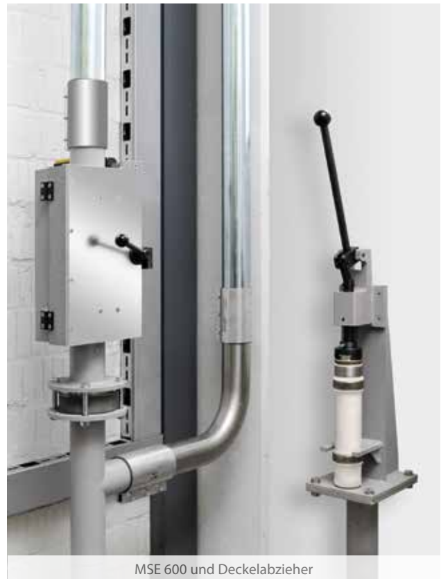
MSE 600 und Deckelabzieher